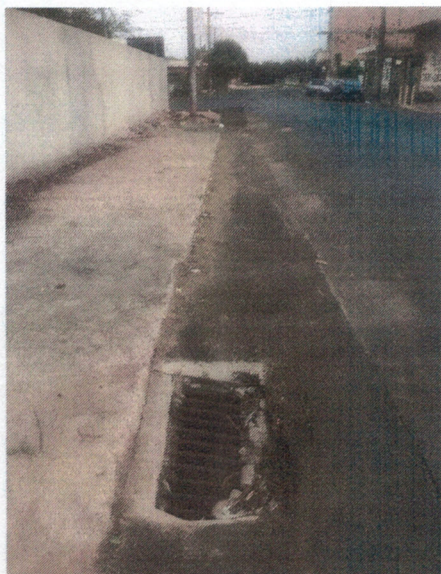
Boca de Lobo Rua João Simão x Av. Arcyr G. Barcellos