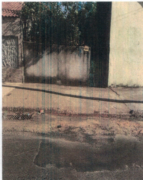
Rua João Simão n° 295