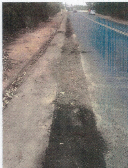
Av. Arcyr G. Barcellos