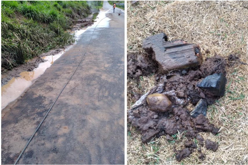
Imagem 1 e 2: À esquerda, limpeza da via Sebastião Vergílio de Carvalho, e à direita, retirada de resíduos acumulados na rede de esgoto, inclusive pode-se notar o descarte de materiais de construção civil (lajota).

Tomado conhecimento do evento, a Concessionária realizou a limpeza e desobstrução da via Sebastião Vergílio de Carvalho, Jardim Centenário. Nesta ocasião foi possível identificar que a causa provável do extravasamento de efluente é o acúmulo e excesso de resíduos sólidos descartados indevidamente pelos usuários, tais como plásticos, tecidos, fios de cabelo, fraldas, absorventes e óleo.