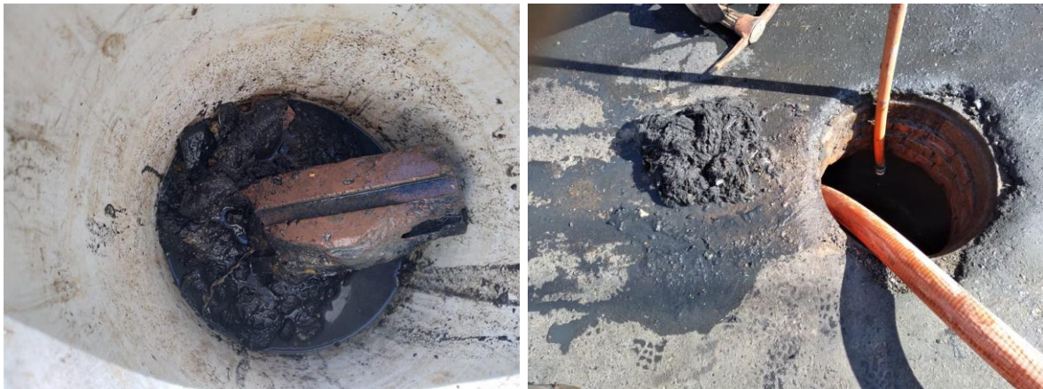
Imagem 3 e 4: Remoção de outros resíduos sólidos potenciais causadores do extravasamento.

Diante deste cenário, a Concessionária reforça que as redes de esgotamento sanitário são projetadas para receber apenas águas servidas dos imóveis, sendo apenas 1% de sua operação capaz de receber resíduos sólidos , não correspondentes aos tipos de resíduos encontrados no presente evento.